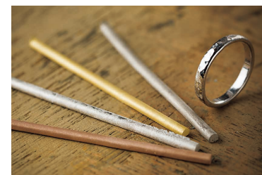
指輪の素材は、10金、18金、ピンクゴールド、プラチナなどから選べる。最初は棒状だった貴金属が、キレイな指輪に変身！※ワークショップは10金のみ

「モノと思い出」 指輪という結婚指輪のイメージが強く、一人ではなかなか来店しづらいという声も聞かれますが、近年では自分だけの特別な指輪を求めて女性お一人での来店も多くなっています。友達同士で製作して思い出をシェアするケースや、娘さんからお母さんへのサプライズプレゼントにされるケースも多数。手づくり指輪は「モノより思い出ならぬ「モノ」と思い出。「スミス」が指輪とともにお渡ししたいのは楽しかったというゲストの「思い出」です。永く心に刻まれる素敵な思い出を、ぜひ作り込みたいと思います。