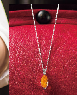
おうちに眠っていた古いジュエリーはどんな状態でもOK。大切な思い出や、込められた想いはそのままに、新しいカタチへと生まれ変わる。

母から娘へ宝石を受け継ぐ「ビジュ・ド・ファミーユ」を 札幌で ヨーロッパには古くから、家族の愛の証として宝石を受け継ぐ「Bijou de famille(ジュ・ド・ファミーユ)」という素敵な文化があります。おばあちゃんやお母さんから受け継いだアクセサリの中には、デザインがちょっと古かったりして、今の服装に合わない、という方もよく相談にいられます。そういったアクセサリたちの石を活かしてモデルチェンジしたり、指輪をネックレスに変身させるなど、今の時代に合った自分好みのお気に切り替えることもできます。祖母から母へ、娘へと受け継がれる歴史や物語、家族への思い……。この札幌でも、そうした文化が広がって欲しいと考えています。