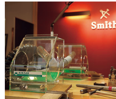
店内にはジュエリーの展示や工房を併設。随時見学を受け付けており、実際の製作工程や金属別の予算についても詳しく説明してくれる。