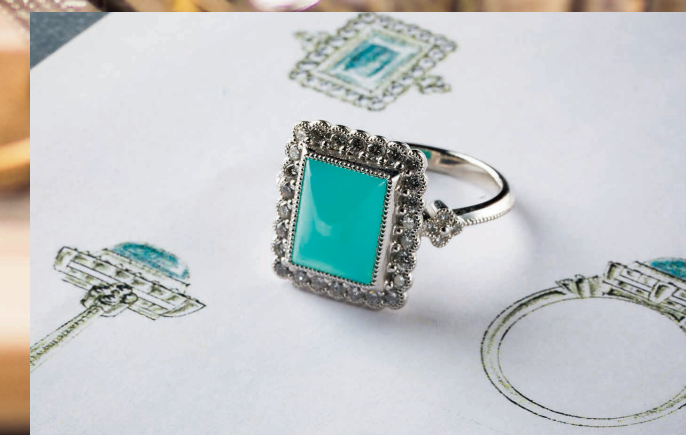
ジュエリーを活かしたいいくつかのデザイン提案をしてもらる。生まれ変わった、自分好みの美しいリングへの仕上りには感動。