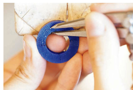
ロウ(ワックス)で型を作って溶かした貴金属を流し込み、磨いて仕上げる「ワックス工法」や貴金属を工具を使って直接加工する「彫金工法」といった結婚指輪制作コースも用意。

一人でも参加可能なワークショップでは、10金で指輪を実際に自分で作ることができる。職人とともに自分の手で作り上げるジュエリーは、世界でたった一つのお気に入り。